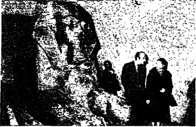
السيد جيهان السادات أثناء زيارتها معحف للوزير امس

وتكررت صحيفة «داشار» ان السادات يمارس لعبة سياسية بارعة للغاية. فقبل زيارة غروبكو وكينسجر للقاهرة، سيطرت بالورقة الأوروبية إلى أقصى درجة. وقالت: ويكتفينا ان ننظر سلسلة من التهديدات الجديدة بالبحر، وغرض الحظر والتفويض من جديد بشبح كسل المناصر المشكلة لحرب الاستنزاف.